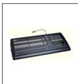
STUDIO 24 SCAN CONTROL "SGM" alloggiata su flightcase