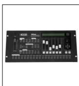
PILOT 2000 "SGM" alloggiata su flightcase