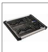
ADB "MIKADO" alloggiata su flightcase