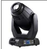
ROBIN MMX SPOT "ROBE" CEE alloggiato su flightcase con ruote lampada: Philips MSR Platinum 35