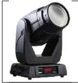
ROBIN 300 BEAM CLASSIC "ROBE" CEE alloggiato su flightcase con ruote lampada: Philips MSD Gold 300/2 Mini Fast Fit