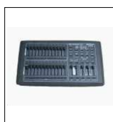
STORM 12/24CH "BOTEX" alloggiata su flightcase