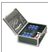
ASSEMBLY 12CH x 2kW "CODEM MUSIC" completo di mixer 12/24CH flightcase Alimentazione 380V 3P+N+T 32A