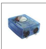
SUNLITE 2048CH USB-DMX software per il controllo di proiettori motorizzati e linee dimmer completo di interfaccia USB-DMX