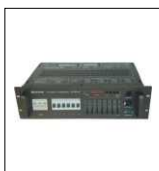
ACTOR616/CEE 6CH x 3kW "ELECTRON" Alimentazione 380V 3P+N+T 32A alloggiato su flightcase