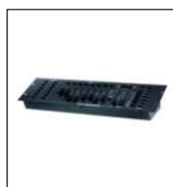
STORM 192CH "BOTEX" alloggiata su flightcase