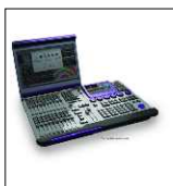
ULTRA VIOLET "COMPULITE" alloggiata su flightcase