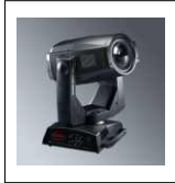
ALPHA SPOT HPE 575 "CLAY PAKY" CEE alloggiato su flightcase con ruote lampada: HMI575W/GS