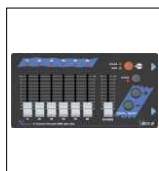
VMIX 6 6CH "CODEM MUSIC"