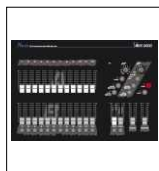
VMIX 2000 12/24CH "CODEM MUSIC" alloggiata su flightcase